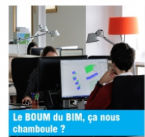
Le BOUM du BIM, ça nous chamboule ?