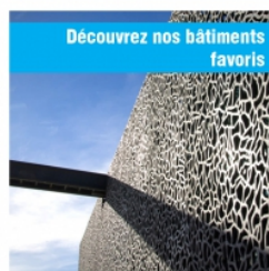
Découvrez nos bâtiments favoris