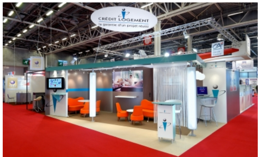
Gestion de l'évènement et logistique