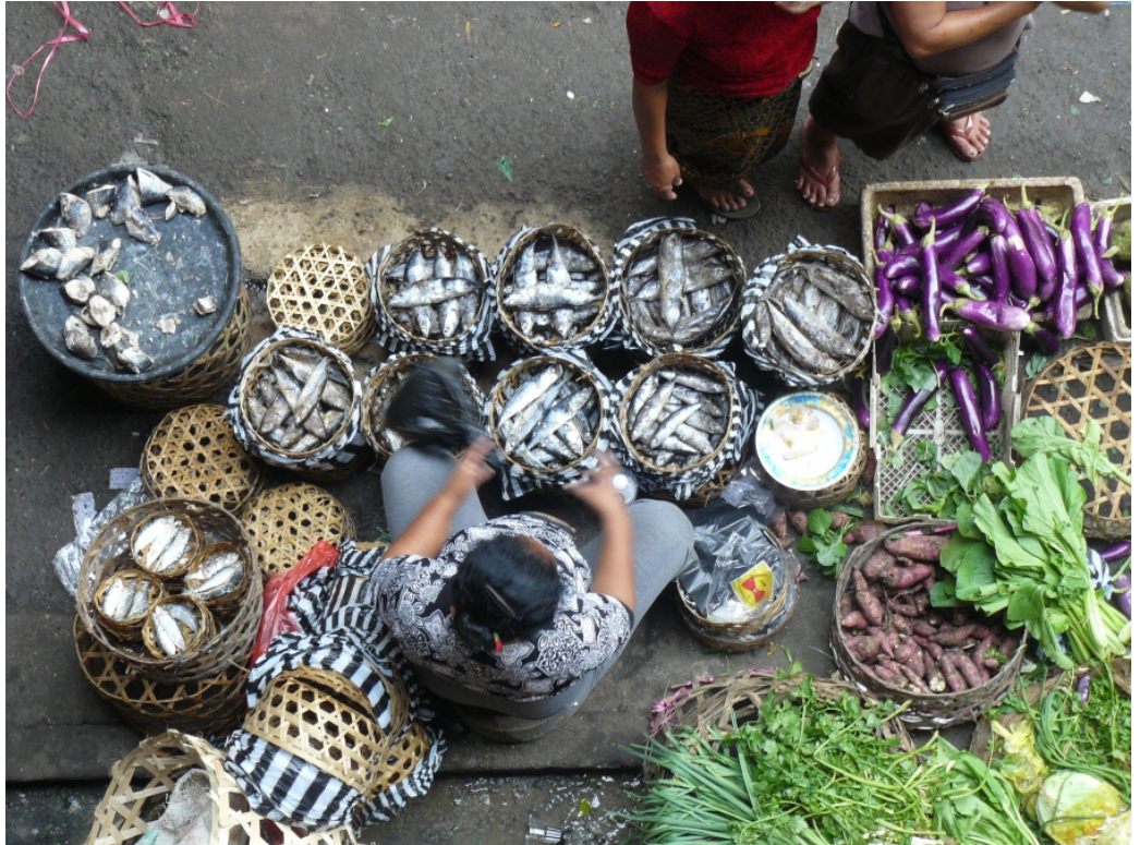
Photographie présentée dans le cadre d'un concours (marché d'Ubud - Indonésie).