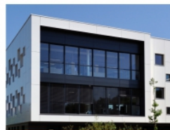
Home Sweet Home : 6 mois dans la nouvelle agence