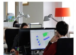
Le BOUM du BIM, ça nous chamboule ?