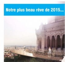
Notre plus beau rêve de 2015...

Conception, rédaction, exe, fichiers imprimeurs. Editée à 1 500 ex, impression sur papier recyclé.