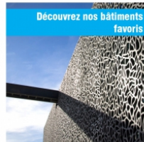
Découvrez nos bâtiments favoris