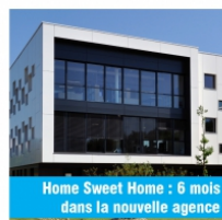
Home Sweet Home : 6 mois dans la nouvelle agence