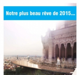
Notre plus beau rêve de 2015...

Conception, rédaction, exe, fichiers imprimeurs. Editée à 1 500 ex, impression sur papier recyclé.